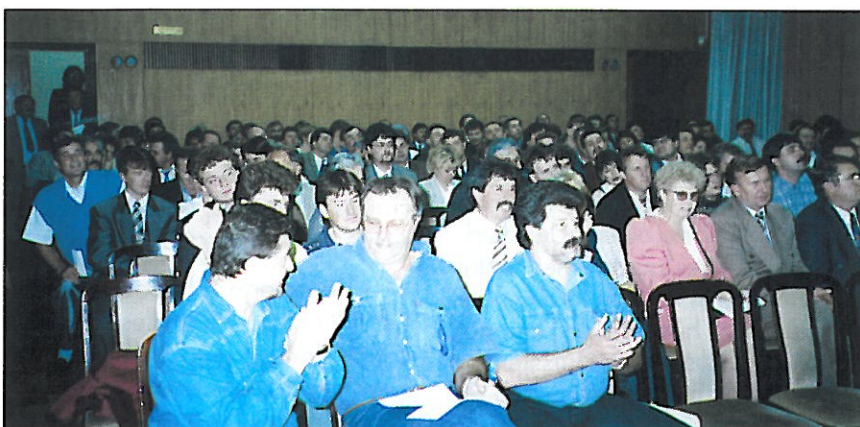
Les Huissiers de Justice hongrois ont participé massivement à leur premier congrès national. The Hungarian bailiffs massively attended their first national congress.

Il existe aussi un comité de trésorerie qui surveille les activités financières de la Chambre. Ainsi, les Huissiers ont l'obligation de payer les cotisations. C'est une somme mineure qui doit être majorée entre autre pour pouvoir payer nos cotisations dans le cadre de l'Union Internationale. Mais il faut attendre que le Forint devienne convertible.