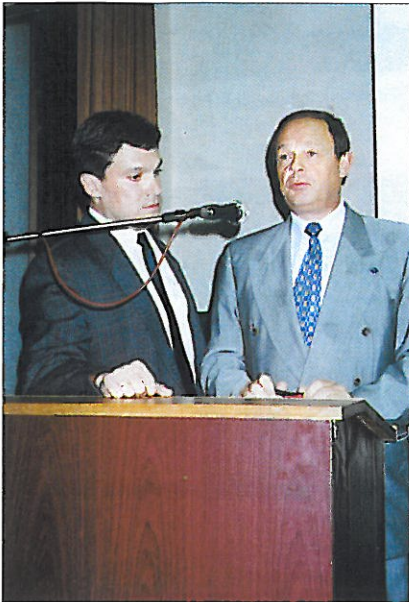
Le discours inaugural de Me J. Isnard, président de l'Union Internationale des Huissiers de Justice, lors du premier congrès de la nouvelle Chambre Nationale des Huissiers de Justice hongrois.

The inaugural speech of Mr J. Isnard, President of the International Union of Bailiffs, at the First Congress of the New Hungarian National Institute of Bailiffs.