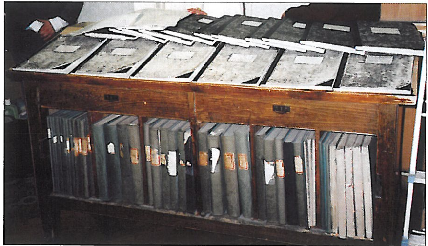
La salle des registres du Tribunal où sont collectés les livres de comptes et les opérations effectuées par les Huissiers de Justice.

Par exemple : pour un fonctionnaire le fait de se rendre sur place lui coûte 700 forints soit environ 42 francs (6 francs = 100 forints) non avancés mais remboursés. De même pour l'ouverture d'une porte chez un débiteur l'huissier doit faire l'avance des 5000 forints soit environ 300 francs remboursables a posteriori .