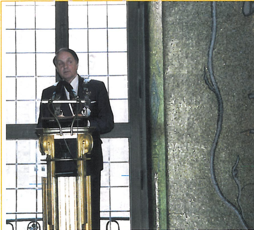
The Mayor of Stockholm receiving the participants in the prestigious golden room of the Town Hall