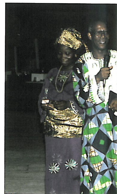
Three Members of file Nationale

One major difficulty appears to lie in sending out courses and organising the checking of students' knowledge.