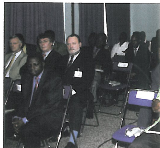
Delegations' chiefs very interested

Training and the introduction of a cooperative structure with the Ecole Nationale de Procédure in France were considered at length. Only 4 national chambers supported this cooperation with the International Union and the French National Chamber of Judicial Officers. Some points of detail remain to be settled to perfect the operation of this structure. President BERTAUX (F) gave a