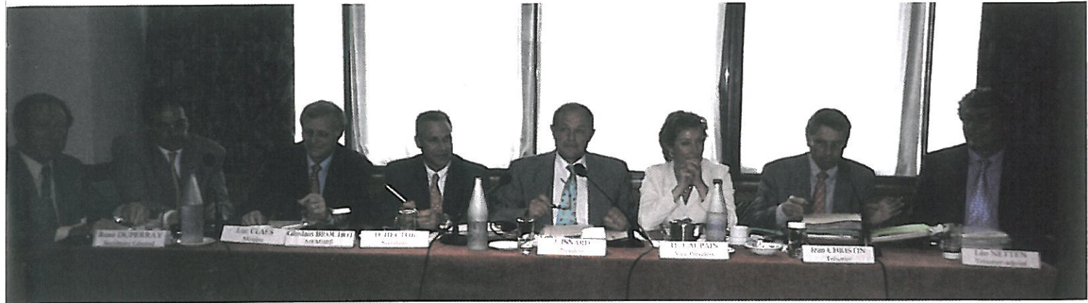
Le bureau de l'UIHJ avec, de gauche à droite :