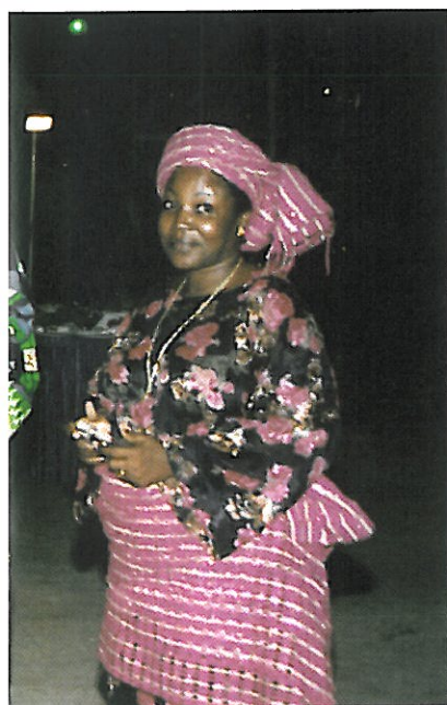
Chamber of Judicial Officers of Benin

All in all, it was a splendid event that fulfilled all the participants' expectations. ♦