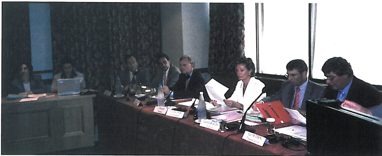
Le bureau exécutif de l'UIHJ lors de l'allocution du Président ISNARD

Les Membres de l'Union Internationale des Huissiers de Justice et Officiers Judiciaires se sont réunis à LONDRES le 29 mars 1998 pour le premier Conseil Permanent Européen. La décision prise de scinder en deux le Conseil Permanent de printemps a été un choix particulièrement judicieux.