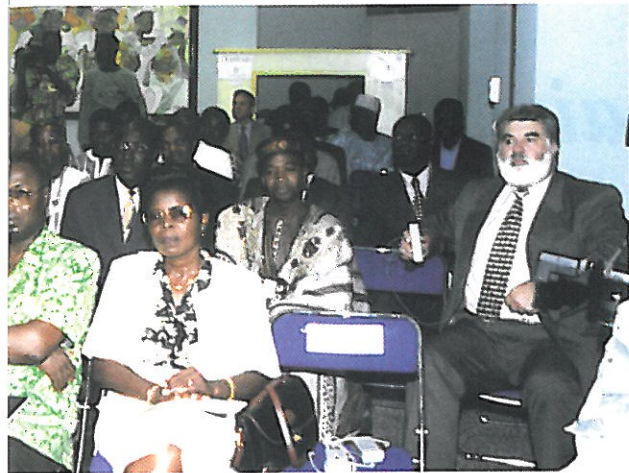
At first line, Mrs General Procuror of Benin

As it is the Ecole Nationale de Procédure in Paris that produces all the course programmes and carries out the corrections and the checking of knowledge, an intermediary centralisation has been planned in Dakar.