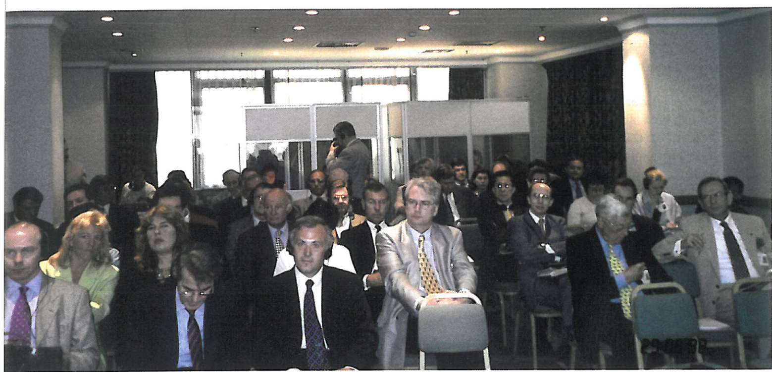
Part of the assembly

tion. This colloquium, organised over two days in the form of round tables, will deal amongst other things with excessive debt, seizure of personal property and the convention on the law of bankruptcy.