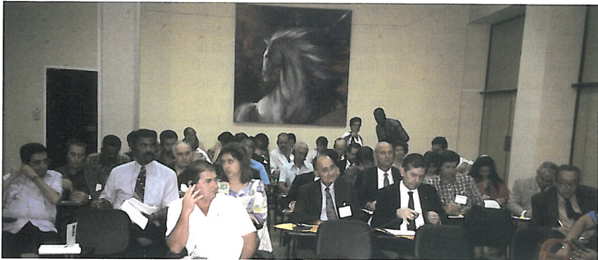
Une partie de l'assistance