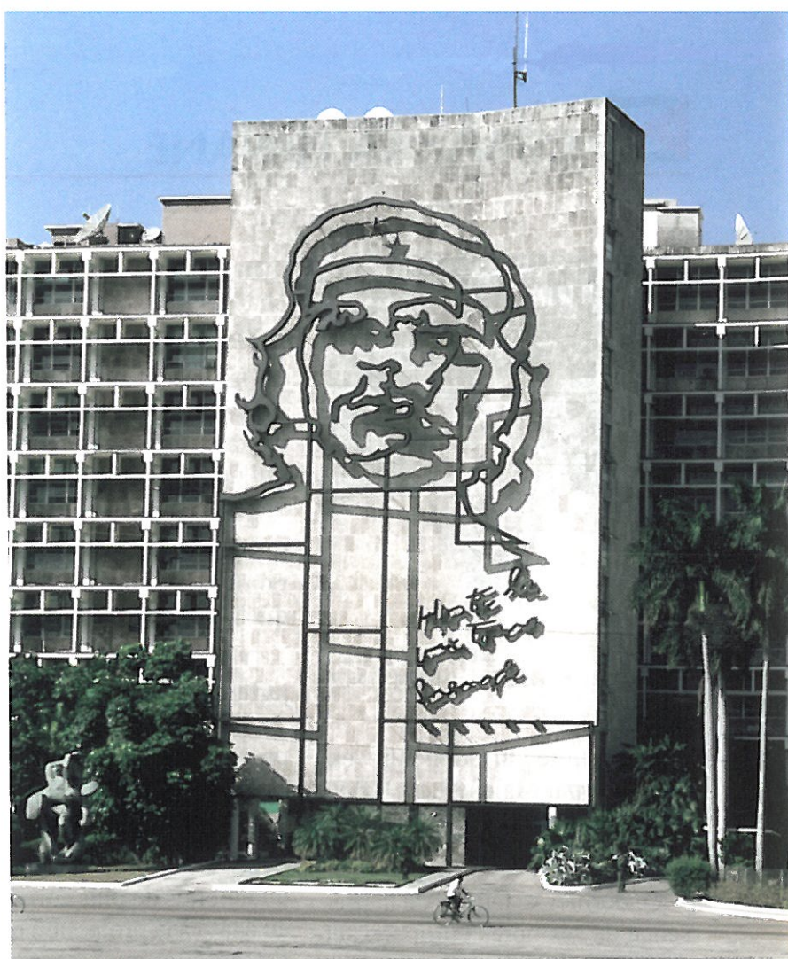
Place de la Révolution

Les rencontres sont significatives : elles démontrent l'intérêt que portent les plus hautes instances de la République de Cuba envers notre profession, l'huisier de justice. Et, par là-même, se découvrent en filigrane le continent sud-américain et sa culture latine. Le chemin à parcourir est encore long mais la tâche est à la hauteur des ambitions que l'Union Internationale s'est fixées.