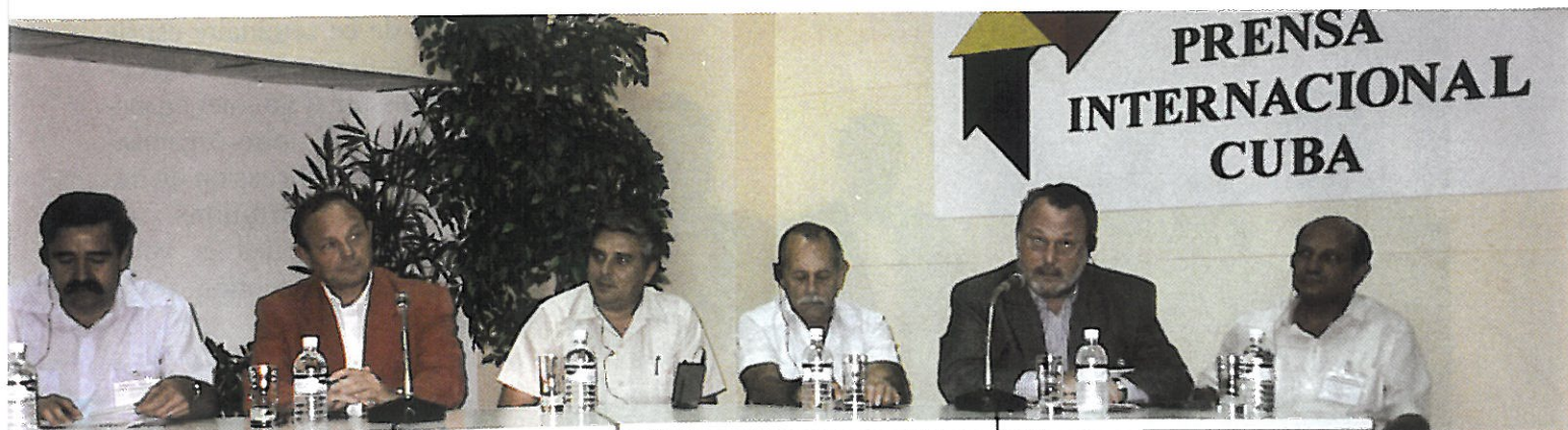
Séance d'ouverture du colloque

consiste à légiférer pour améliorer les règles existantes afin de les hisser au niveau des besoins nouveaux, tout en veillant à les mettre à l'épreuve des dérives dont profiteraient immanquablement les éléments marginaux (trafiquants, mafia...).