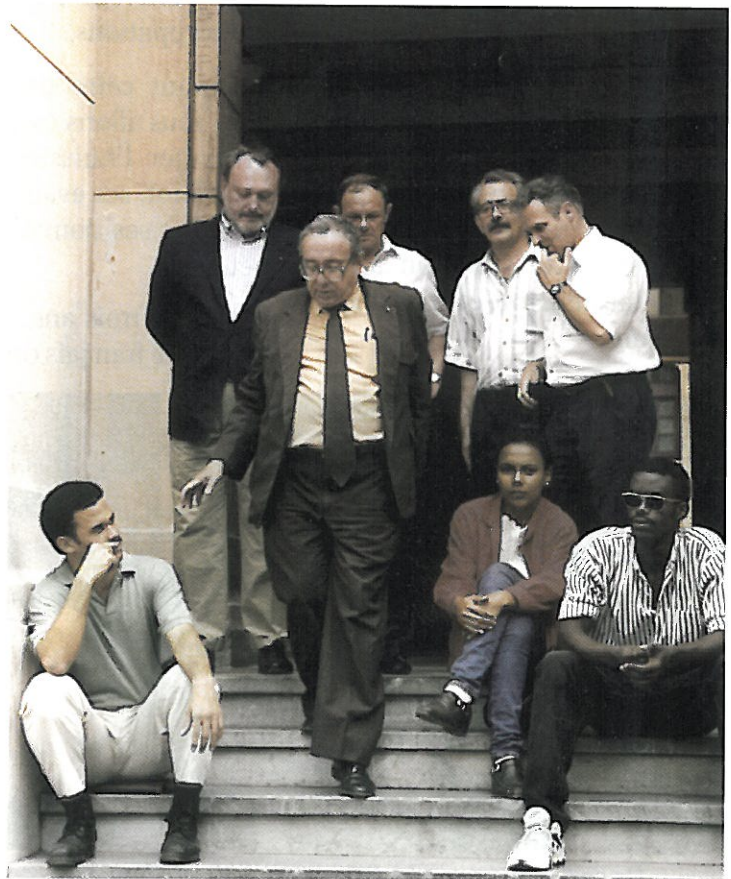
Visite "privée" de l'Université de droit de La Havane

Le monde économique ne peut plus se satisfaire de quelque retard que ce soit dans l'exécution des décisions de justice.