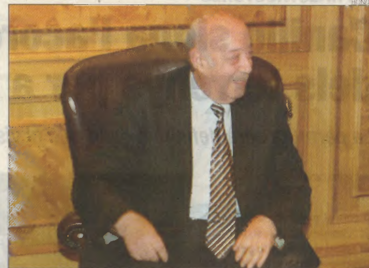
Es vol aconseguir externalitzar les execucions.

vistes que Menut ha de mantenir tant amb representants polítics com amb representants de la societat civil, és possible que des de l'associació es pugui proposar un model que es pugui aplicar a Andorra i que serveixi al mateix temps per agilitzar la tramitació de totes les execucions civils. ■