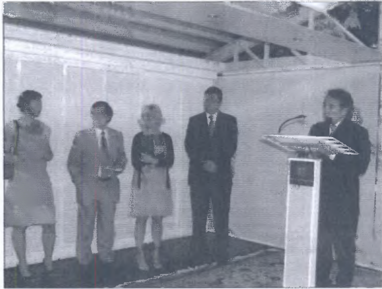
El cap de Govern, Jaume Bartumeu, ahir, durant el discurs ofert en el seminari.

El seminari del Moneyval coincideix amb el procés avaluador que està passant el Principat, que s'acabarà el març del 2011, segons va confirmar ahir