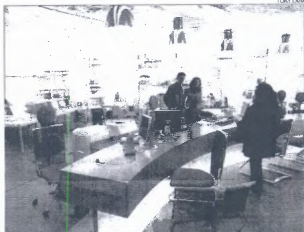
► L'oficina de tràmits del Comú d'Andorra la Vella.

Les taxes per la higiene i l'enllumenat són les menys reemborsades pels residents canillencs. Ho demost-