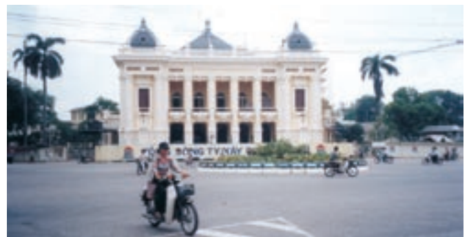
L'Opéra de Hanoi - The Hanoi Opera