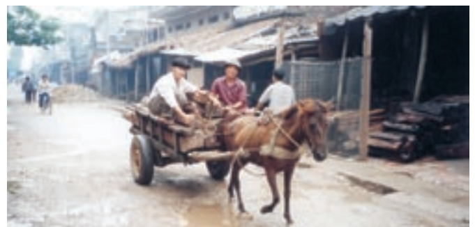
Un village dans le Nord du Vietnam - A village in North Vietnam