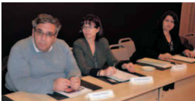
Les délégations de ARY-Macédoine et de Bulgarie The delegations from the FYRO-Macedonia and Bulgaria