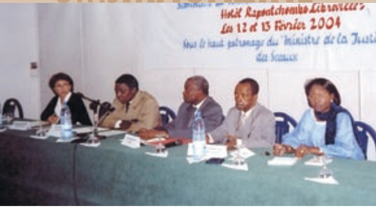
Les intervenants du séminaire - The participants