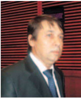
Marius Crafcenko, président de la Chambre nationale des huissiers de justice de Roumanie - Marius Crafcenko, President of the National Chamber of the Judicial Officers of Romania