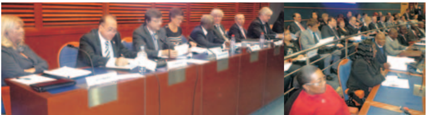
Le bureau de l'UIHJ - The board of the UIHJ