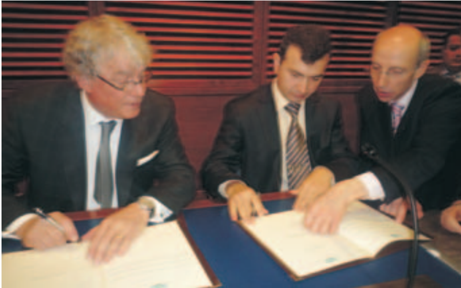
Signature de l'adhésion de la Moldavie à l'UIHJ Signature of the membership of Moldova at the UIHJ

projet concernant la lutte contre la criminalité. Au Danemark, une réforme des tribunaux est en cours. Les 85 départements de l'exécution ont migré vers les vingt-deux tribunaux de districts. Dorénavant, les huissiers de justice peuvent réaliser directement des saisies immobilières par voie électronique dans le registre des immeubles. Il en va de même pour les véhicules automobiles depuis novembre 2010. La crise économique a eu pour effet d'augmenter le nombre de dossiers d'exécution de 30 à 50% au cours des deux ou trois dernières années. Pour autant, le nombre de vente aux enchères est en baisse depuis l'été. En Suède, les quatre services de l'exécution vont fusionner, afin de réaliser des économies. Une nouvelle loi sur le surendettement verra le jour en 2011. Une proposition de loi est également en cours concernant la vente des biens par Internet.