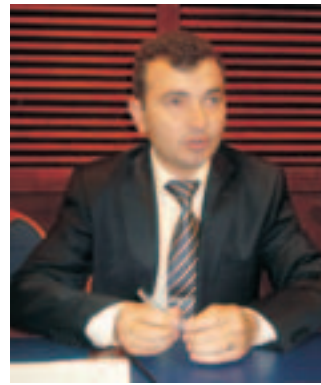
Roman Talmaci, président de la Chambre nationale des huissiers de justice de Moldavie - Roman Talmaci, President of the National Chamber of the Judicial Officers of Moldova